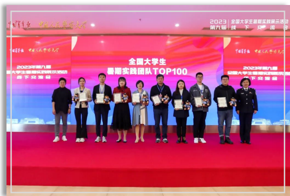
▲ 团队入选全国大学生暑期实践团队TOP100

近日，由中国青年报组织开展的2023年第九届全国大学生暑期实践展示活动评选结果揭晓。我校第一临床医学院“薪火实践团”再次入选全国大学生暑期实践团队TOP100。