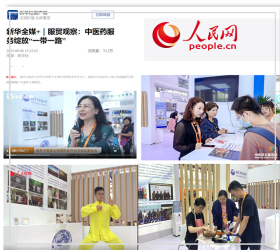
▲ 多家中央级媒体报道我校服贸会参展成果

此次参展，学校从榜样力、创新力、成果力、传播力等四个方面展示了中医药综合服务能力和高质量发展的新成果。成果展示受到了来自人民网、新华网、央视网等多家中央级媒体的报道。