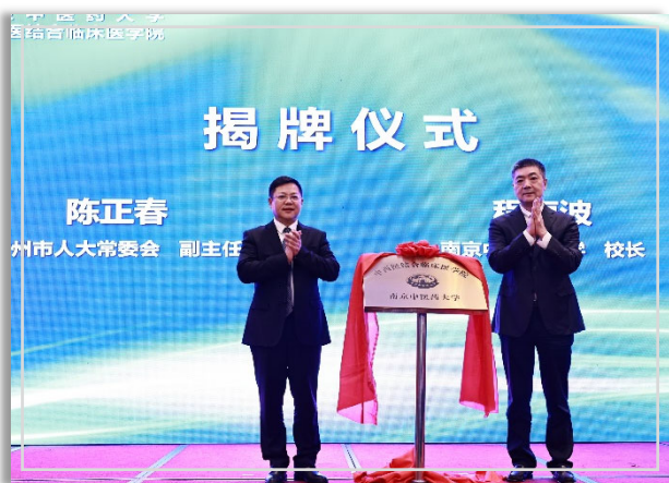
▲ 南京中医药大学中西医结合临床医学院揭牌

9月27日，我校与常州市第一人民医院共建南京中医药大学中西医结合临床医学院签约揭牌仪式在常州举行。