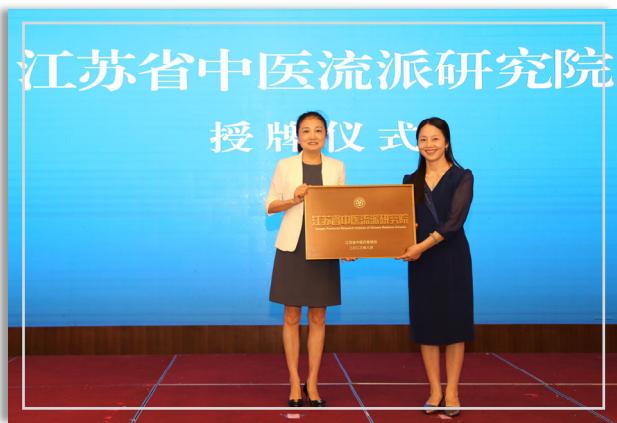
▲ 江苏省中医流派研究院授牌