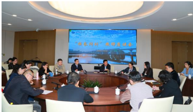
“校长问计”座谈会现场

与会教师结合国家发展、学校事业及个人经历，就学科建设、本科教育、师资队伍、行政能力、考评体系、师德师风、校园生活等方面畅所欲言、各抒己见，尤其对提高本科教学质量、促进科研团队建设、振兴中医学科、培育人才队伍梯队、做好民生保障、促成部门信息共享等事关学校事业发展的关切问题提出许多金点子、好建议。近4个小时的时间里，座谈会气氛热烈、互动频繁，胡刚随时解答疑难，不少问题现场要求督办，短期难以解决的重大问题也将作为学校下一步改革发展的重点进行规划，真正做到发展为了师生、发展依靠师生，让学校发展红利更好地惠及广大师生。