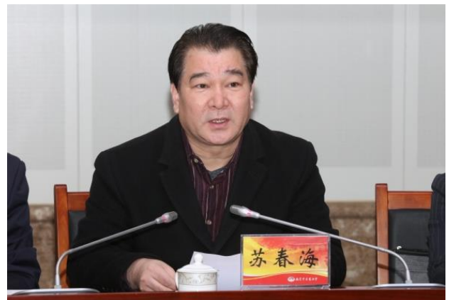
江苏省委教育工委书记苏春海致辞

江苏省委教育工委书记苏春海，江苏省卫生健康委副主任、省中医药管理局局长朱岷和全体校领导出席会议。会议由副校长乔学斌主持。