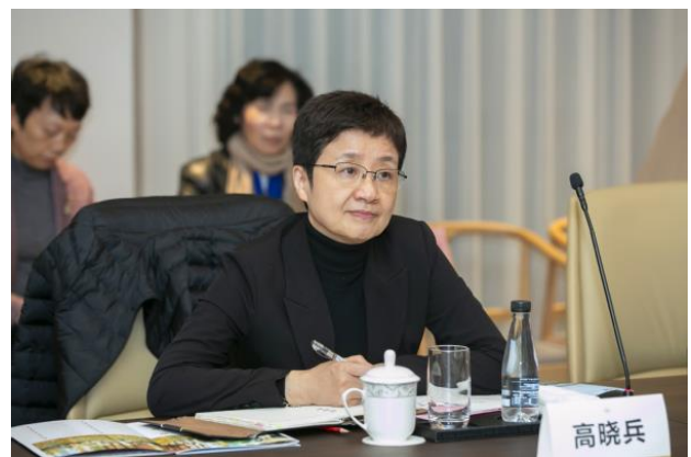
民政部副部长高晓兵讲话

吕德明向高晓兵一行介绍合作建院基本情况，详细汇报了学院建设的愿景和规划。他表示，将以国家需求为导向，与南京中医药大学强强联合，在人才培养、继续教育、实训基地建设、政产学研合作及机制保障等方面，与学校开展高效务实的深度合作，为养老服务事业培养复合型高技能人才和高级管理人才。他恳请民政部继续关心支持学院的建设发展，在学院学科建设、师资配备、人才引进、资金支持和基地建设上给予指导和帮助，共同将学院建设成为全国养老服务管理人才的“黄埔军校”。