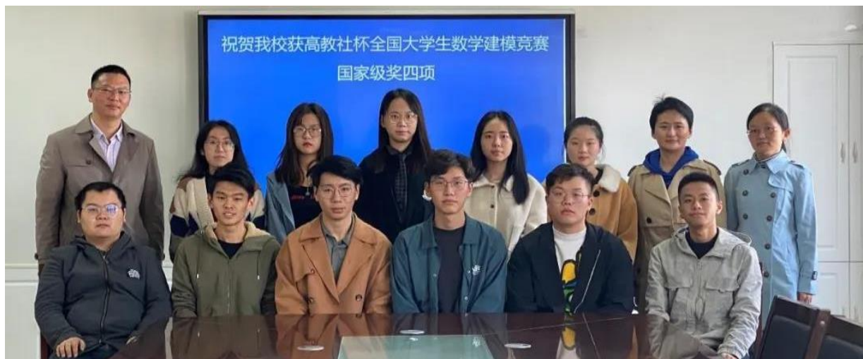
全体国奖获得者和教练组老师

竞赛自5月份启动以来，在教务处等部门的全力支持下，人工智能与信息技术学院经多次研讨，制定疫情期间线上线下相结合的集训方案。全体数学教研室教师组成训练辅导教师团队，分工明确，各司其职，充分利用暑期和节假日时间，带领全校29支参赛队伍进行统计、优化、算法三个板块的强化集训，指导学生不断精练建模方法、熟悉统计编程、夯实优化理论、多次模拟实战，参赛团队在老师们的辛勤指导下，刻苦训练，终于取得骄人成绩。