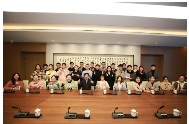
“校长问需”与会人员合影

们还要以探路者、先行者、改革者的要求审视自己，在中国传统医药的基础上吸收现代技术成果，做人才培养改革的实践者、受益者。科学研究方面，胡刚结合青蒿素的发现过程、诺贝尔奖的最新成果、破“四唯”“五唯”与高水平学术成果的辩证关系与同学们娓娓道来，勉励同学们传承好、发展好中医药这一民族的瑰宝，创造出有民族特色、有原创水平的技术成果，在未来的国际竞争中立于不败之地。第二课堂活动方面，胡刚建议同学们的选择要多与专业和兴趣相关，快乐活动、提升能力，不可变成“演员”、成为负担。此外，胡刚还特别关心了研究生补贴兑现情况、实习基地分配情况、交换生学分认定情况、食堂宿舍是否满意等问题，对同学们的合理诉求当场安排相关部门督办并限期解决。