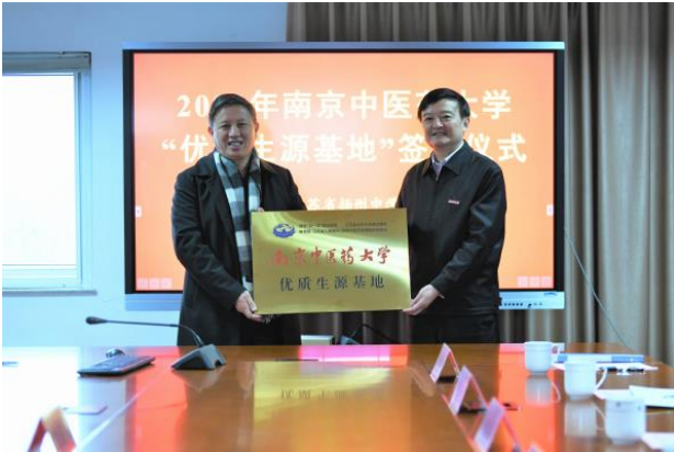
党委书记程纯为扬州中学授牌

程纯授予扬州中学“南京中医药大学优质生源基地”铜牌，赠与扬州中学《中药大辞典》和中医文化研究中心牵头主编的“中医文化研究”系列丛书，并送上扬州中学毕业学子在我校获奖情况喜报。